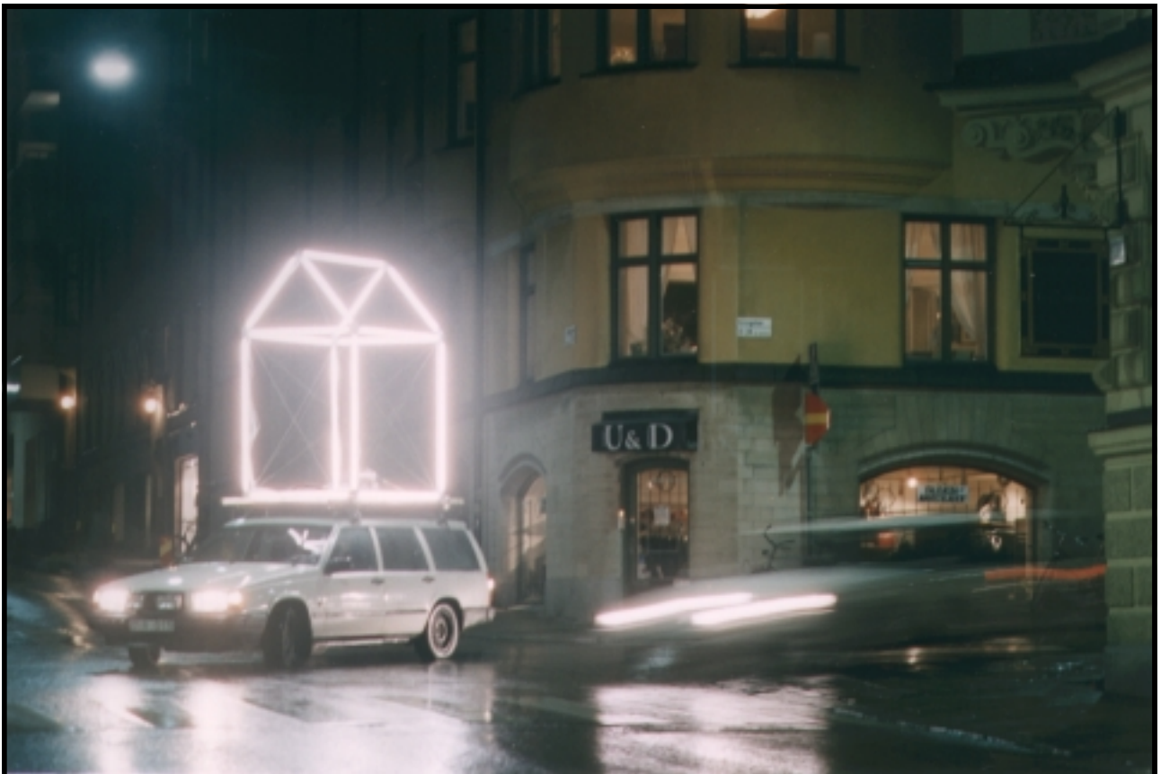
Lysrörshus Konstnär: Mikael Richter 1998